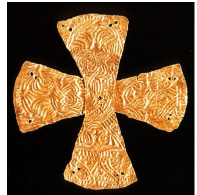
Foto: Das alamannische Goldblattkreuz aus Lauchheim, Grab o ist das Objekt des Monats Juni im Alamannenmuseum.

werden als christliche Symbole gedeutet und markieren die letzte Phase der frühmittelalterliche Beigabensitte, bevor diese um 700 n. Chr. endet.